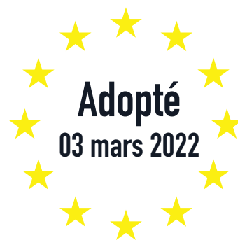
Schéma directeur d'aménagement et de gestion des eaux (Sdage) 2022-2027 du bassin Loire-Bretagne